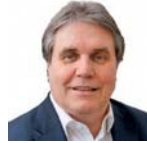
Herbert Fromme Süddeutsche Zeitung